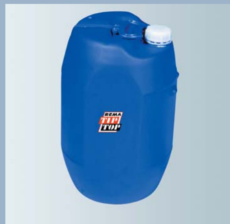
593 12 60 TT SEAL XXL 60 Liter PE-Fass