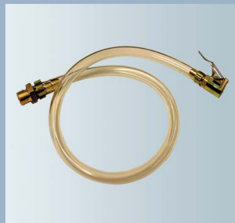
593 12 84 Ventiladapter von Handpumpenschlauch zum Ventil