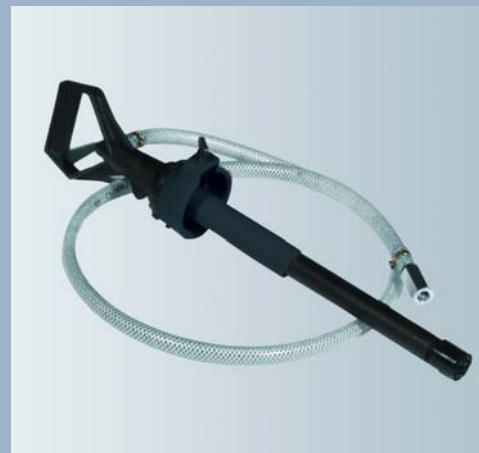
593 12 77 TT SEAL XXL Handpumpe